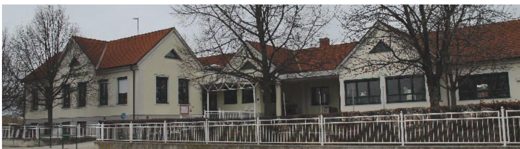
Schulkomplex der Neuen Volksschule Müllendorf