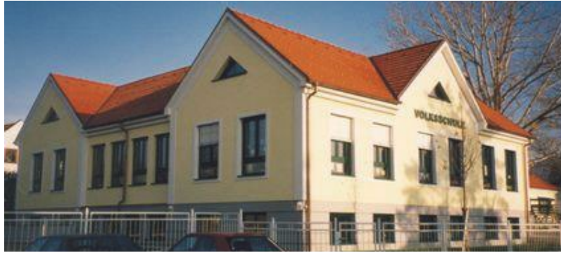
Lehrkräfte im Eröffnungsjahr der neuen Volksschule :